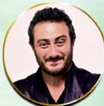
PRESIDENTE DI GIURIA

Pianista, Compositore, Direttore di Coro e d'Orchestra. Già Direttore Musicale della Compagnia della Rancia in importanti Musical Italiani.